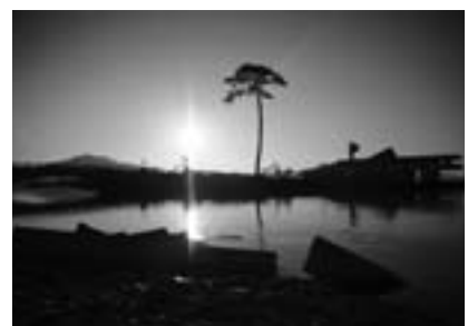
日本百景に選ばれた名勝「高田松原」で津波の猛威に耐え1本だけ残った松「希望の松」と言われている